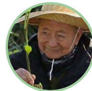
Dr Akira MIYAWAKI JAPON